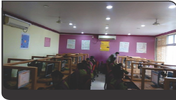
SCOPE SESSION IN PROGRESS (LAB.2)