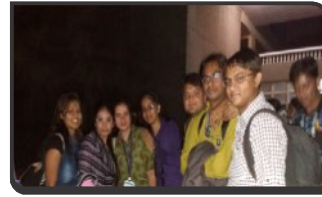
FIELD WORK IN SLUM AREA OF PBR.