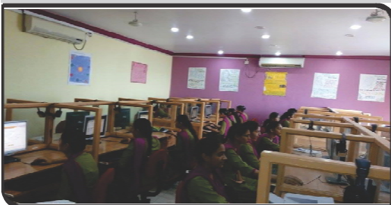
SCOPE SESSION IN PROGRESS (LAB.2)