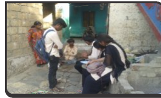
FIELD WORK AT VRUDHASHRAM