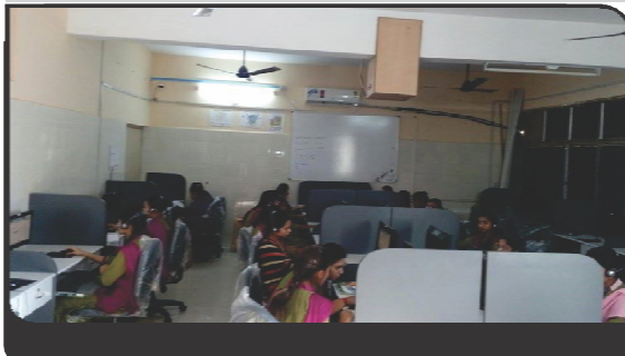
SCOPE SESSION IN PROGRESS (LAB.1)